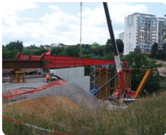
Retour en image sur la visite du chantier de la passerelle reliant la Bastide au Puy Ponchet avec la Mission locale le 7 juin