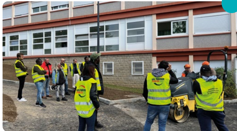
Retour en image sur la visite de chantier organisée avec Pôle Emploi Limoges au CROUS de la Borie.