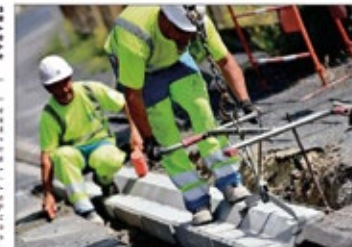
FRTP. Les entreprises des Travaux Publics recrutent et anticipent le rebond. L'ACTUALITÉ LIMOUSINE

Pour l'instant, c'est l'incertitude qui prédomine pour 2023. « Il y a peu d'impact d'effet pour l'instant. Et outre les baisses de commandes promises de l'énergie, des collectivités et des entreprises », et les réalités budgétaires des collectivités, l'impact n'est pas simple à évaluer, souligne Sébastien Berna.