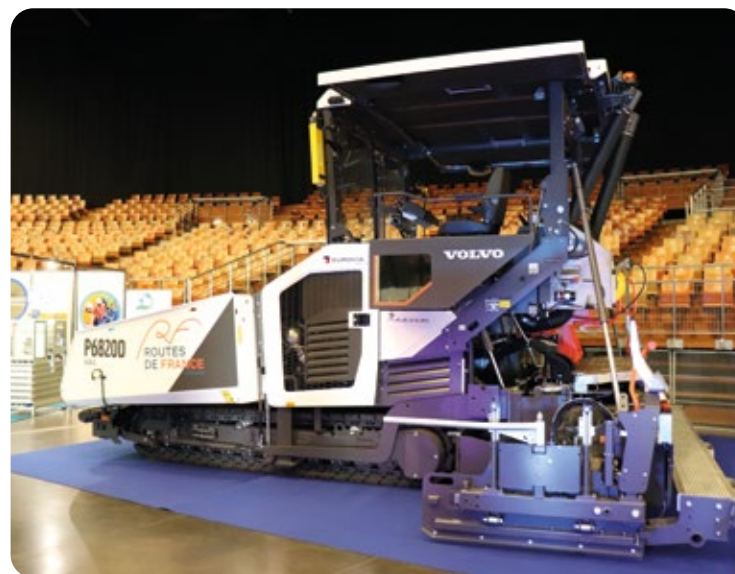
Salon des Travaux Publics